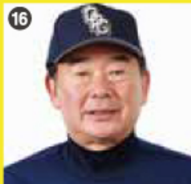
元プロ野球選手 名球会会員 西武黄金時代を支えたエース 1995-2001西武ライオンズ監督 東尾 修