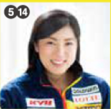
パラアルペン スキー選手 村岡 桃佳