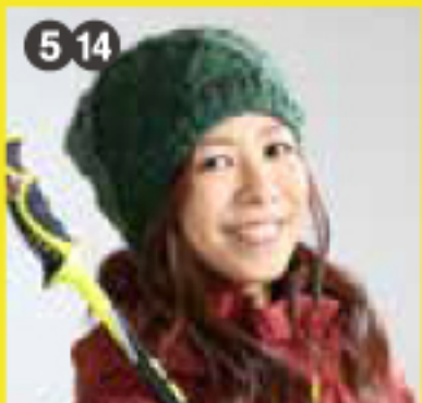
元フリースタイル スキー選手 梅原 玲奈