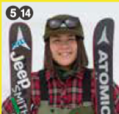
フリースタイル スキー選手 小野塚 彩那