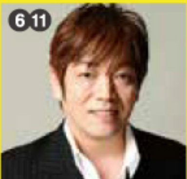
お笑い芸人 日本ダイエット健康協会認定 ダイエットインストラクター ヤセ騎士(ナイト)